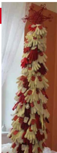
1. místo Nové Veselí