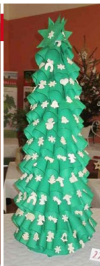
2. místo Sazomín