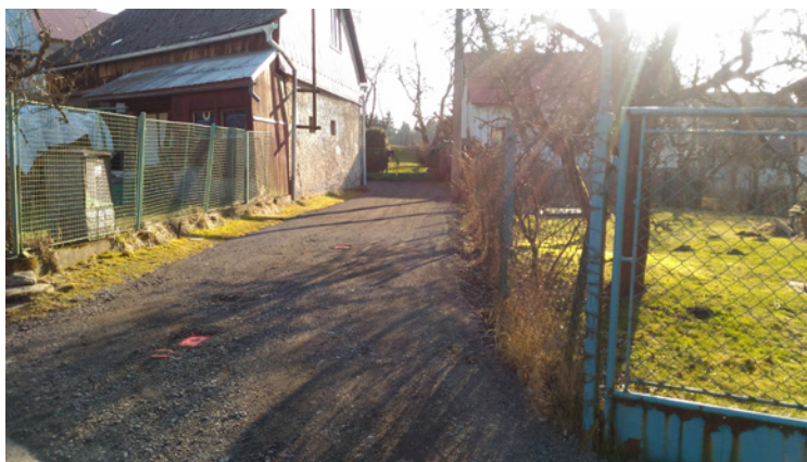
Nová příjezdová cesta k čp. 41, Kasalovi.

Příští zasedání zastupitelstva se bude konat v pondělí 23. 4. 2018 od 19:00 hodin.